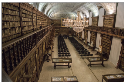
1. Biblioteca Nazionale Braidense sala Maria Teresa