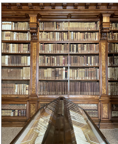
4. Biblioteca Nazionale Braidense