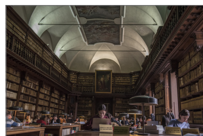
3. Biblioteca Nazionale Braidense