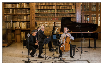
8. Biblioteca Nazionale Braidense BreraMusica in Braidense