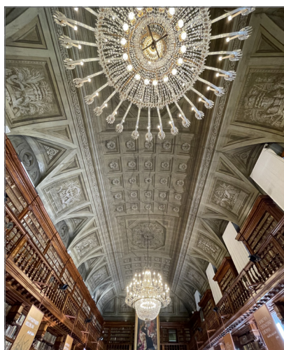
5. Biblioteca Nazionale Braidense