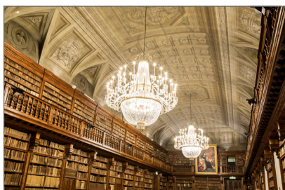
2. Biblioteca Nazionale Braidense sala Maria Teresa