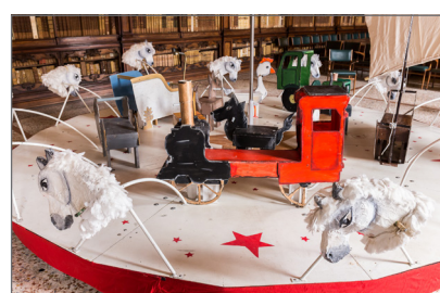
6. La Giostra delle Storie nella Sala Lettura della Biblioteca Braidense