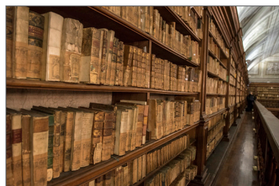
3. Biblioteca Nazionale Braidense sala Maria Teresa