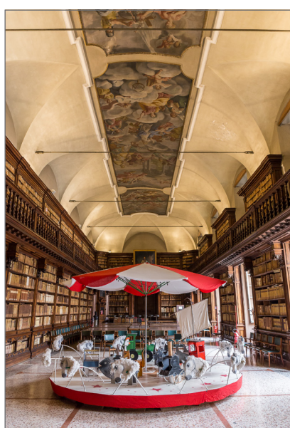
5. La Giostra delle Storie nella Sala Lettura della Biblioteca Braidense