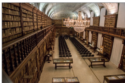
2. Biblioteca Nazionale Braidense sala Maria Teresa