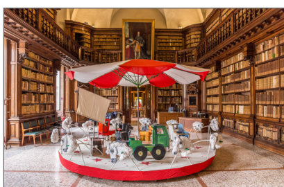
7. La Giostra delle Storie nella Sala Lettura della Biblioteca Braidense