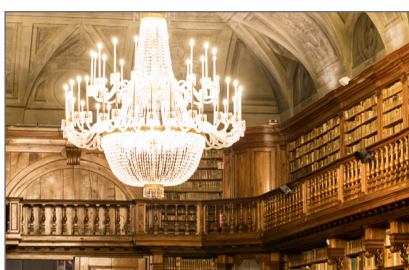
4. Biblioteca Nazionale Braidense sala Maria Teresa, dettaglio del lampadario