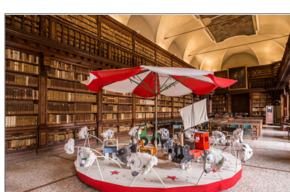
8. La Giostra delle Storie nella Sala Lettura della Biblioteca Braidense