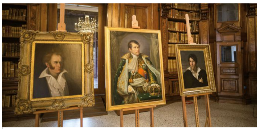
I ritratti di Foscolo, Napoleone e Manzoni in mostra