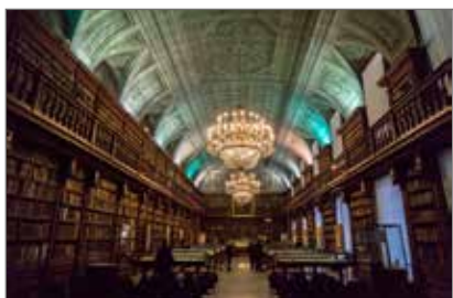
1. Biblioteca Nazionale Braidense sala Maria Teresa

SELEZIONE IMMAGINI PER LA STAMPA Scaricabili ad alta risoluzione nella sezione "Area Stampa" del sito www.pinacotecabrera.org/area-stampa/