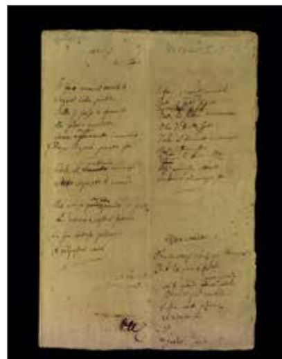
3. Prima carta della minuta autografa del 5 maggio di Alessandro Manzoni Biblioteca Nazionale Braidense