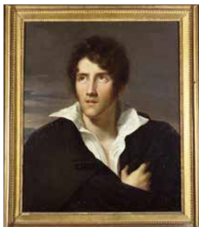
5. Pittore anonimo Alessandro Manzoni a 20 anni 1805 Olio su tela attribuito a Maria Cosway