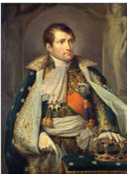
4. Giuseppe Diotti Ritratto di Napoleone I imperatore 1810 olio su tela