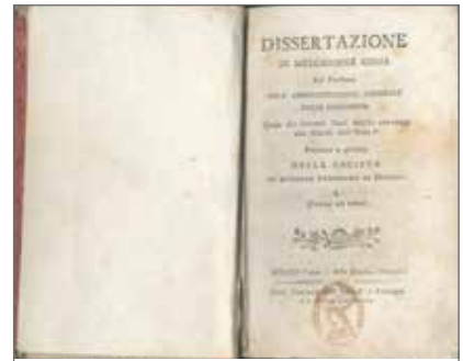
9. Melchiorre Gioia Dissertazione di Melchiorre Gioia sul problema dell'amministrazione generale della Lombardia. Quale dei governi liberi meglio convenga alla felicità dell'Italia? Premiata a giudizio della Società di pubblica istruzione di Milano [...] Milano, nella stamperia altre volte di S. Ambrogio a S. Mattia alla Moneta, l'anno i. della Repubb. Cisalpina [1797-1798]