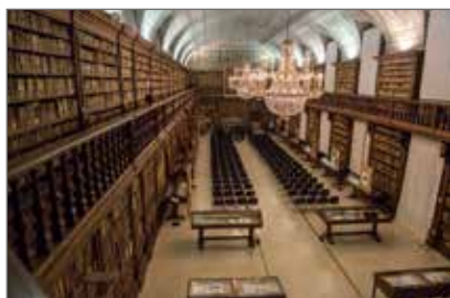
2. Biblioteca Nazionale Braidense sala Maria Teresa