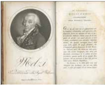
7. Giovanni Villani, Istorie fiorentine di Giovanni Villani cittadino fiorentino fino all'anno xmcccxlviii . Vol. primo Milano, dalla Società tipografica de' classici italiani, 1802