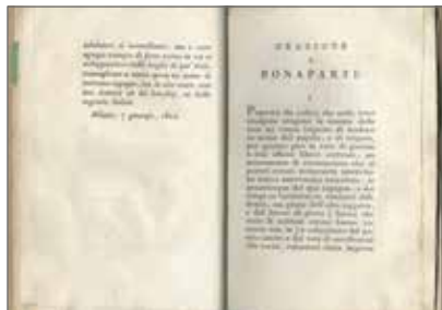
8. Ugo Foscolo Orazione a Bonaparte pel Congresso di Lione Italia, [s.n.], 1802