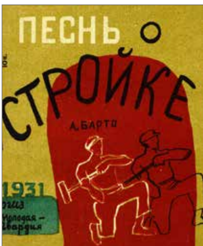
16. Agnija Barto Un inno alla costruzione ( Pesn' o strojke ), Mosca, Molodaja gvardija, 1931. Illustrazioni di Tat'jana Mavrina. Collezione Adler, Biblioteca Nazionale Braidense