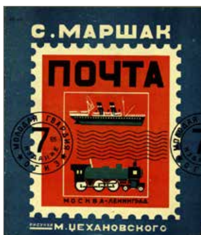
10. Samuil Maršak Posta (Pošta) , Leningrado, Molodaja gvardija, 1932 (settima edizione). Illustrazioni di Michail Cekanovskij. Collezione Adler, Biblioteca Nazionale Braidense