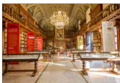
5. Biblioteca Nazionale Braidense Sala Maria Teresa Allestimento mostra TEMPI TERRIBILI - LIBRI BELLI La collezione Adler alla Biblioteca Braidense