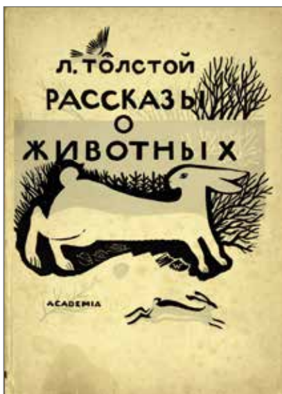
13. Lev Tolstoj Storie di animali ( Rassказы o životnyh ). Mosca, Academia, 1932. Illustrazioni di Vladimir Favorskij. Collezione Adler, Biblioteca Nazionale Braidense