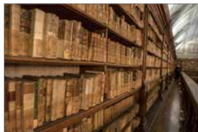
3. Biblioteca Nazionale Braidense Sala Maria Teresa