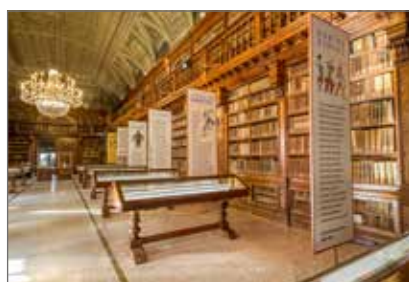
4. Biblioteca Nazionale Braidense Sala Maria Teresa Allestimento mostra TEMPI TERRIBILI - LIBRI BELLI La collezione Adler alla Biblioteca Braidense