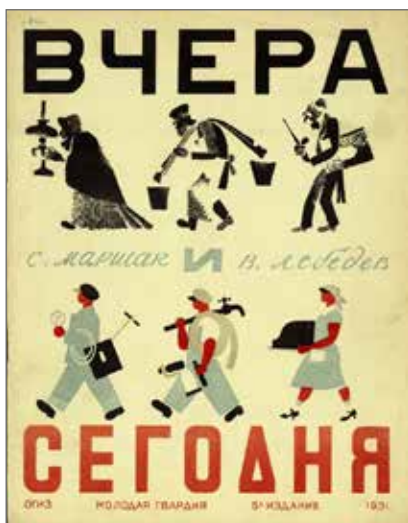
7. Samuil Maršak Ieri e oggi (Včera i segodnja) , Leningrado, Molodaja gvardija, 1931 (quinta edizione). Illustrazioni di Vladimir Lebedev. Collezione Adler, Biblioteca Nazionale Braidense