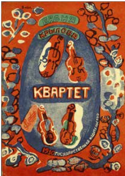
19. Ivan Krylov, Il Quartetto (Kvartet) , Leningrad, Gosudarstvennoe izdatel'stvo 1930. Illustrazioni di Vera Ermolaeva. Collezione Adler, Biblioteca Nazionale Braidense