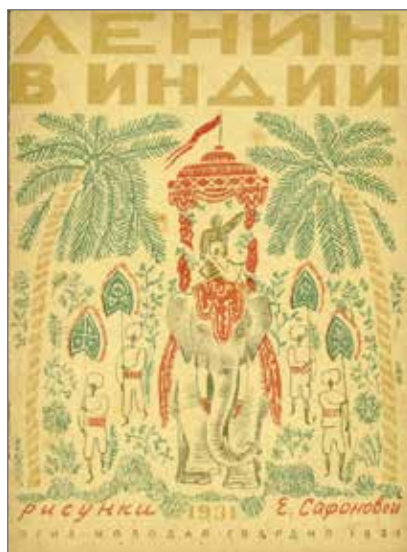
8 Elena Safonova, Lenin in India (Lenin v Indii) , Leningrado, Molodaja gvardija, 1931. Illustrazioni dell'autrice. Collezione Adler, Biblioteca Nazionale Braidense