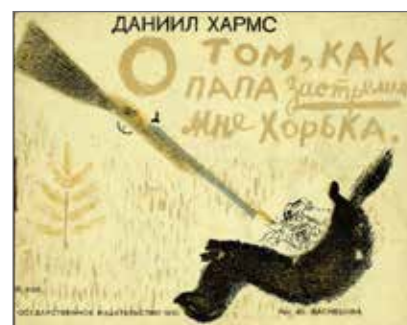
12. Daniil Charms, Come papà ha sparato per me a una puzzola (O tom, kak papa zastrelil mne chor'ka) , Leningrado, Gosudarstvennoe izdatel'stvo, 1930. Illustrazioni di Jurij Vaznecov. Collezione Adler, Biblioteca Nazionale Braidense