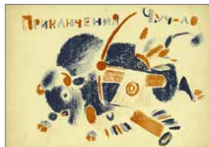
17. Vladimir Lebedev, Le avventure di uno spaventapasseri ( Priključenija Čuč-lo ), Petersburg, Epocha, 1922. Illustrazioni dell'autore. Collezione Adler, Biblioteca Nazionale Braidense