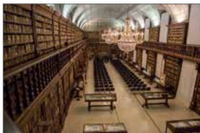
2. Biblioteca Nazionale Braidense Sala Maria Teresa