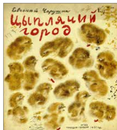
9. Evgenij Čarušin, La città dei pulcini ( Cyplicij gorod ), Leningrado, Molodaja gvardija, 1931. Illustrazioni dell'autore. Collezione Adler, Biblioteca Nazionale Braidense