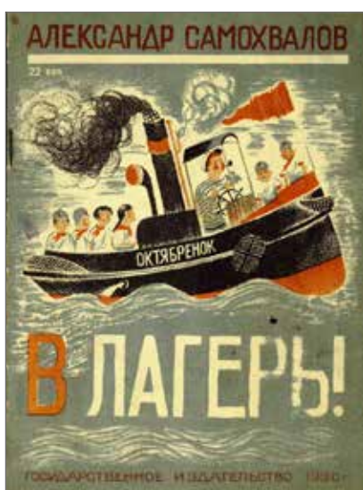
11. Aleksandr Samochvalov, Al Campo! (V lager'!) , Leningrado, Gosudarstvennoe izdatel'stvo, 1930. Illustrazioni dell'autore. Collezione Adler, Biblioteca Nazionale Braidense