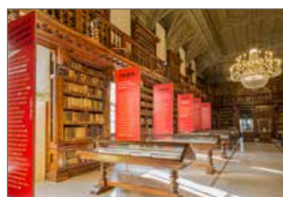
6. Biblioteca Nazionale Braidense Sala Maria Teresa Allestimento mostra TEMPI TERRIBILI - LIBRI BELLI La collezione Adler alla Biblioteca Braidense