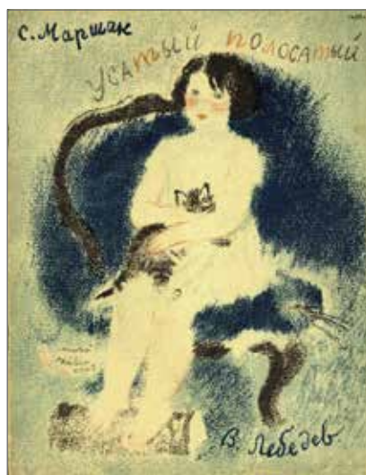
14. Samuil Maršak Baffuto e a strisce ( Usatyj polosatyj ) Leningrado, Molodaja gvardija, 1931 (seconda edizione). Illustrazioni di Vladimir Lebedev. Collezione Adler, Biblioteca Nazionale Braidense